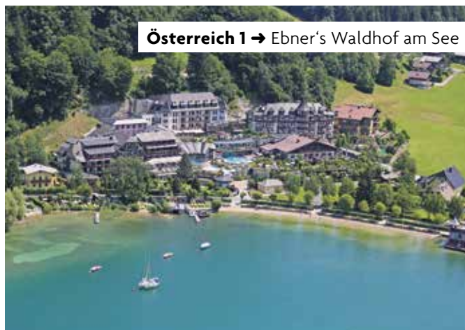
Österreich 1 → Ebner's Waldhof am See