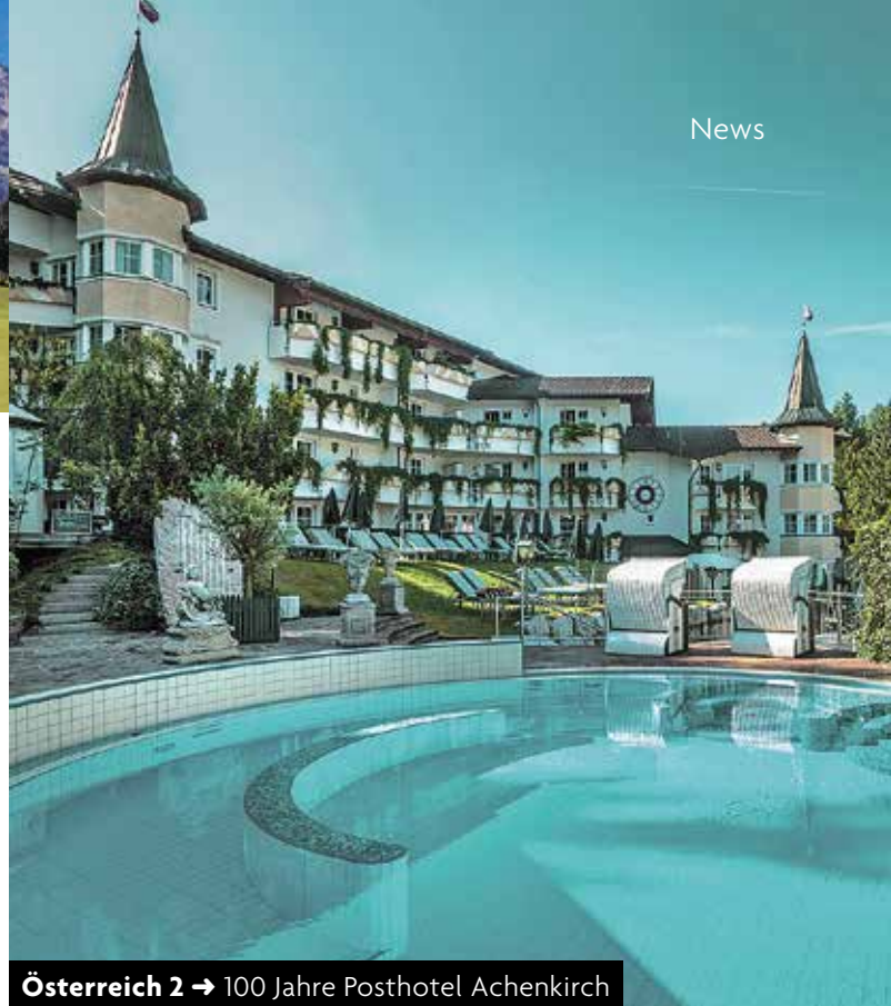
Österreich 2 → 100 Jahre Posthotel Achenkirch

RUNDE SACHE IN DER HÖHENLUFT Das Posthotel Achenkirch unweit des Achensees in Tirol feiert dieses Jahr sein hundertjähriges Bestehen. Das Traditions Haus für Gäste ab 14 Jahren wuchs mit der Zeit zu einem großzügigen 5-Sterne-Anwesen mit unverwechselbarem Ambiente und einem breitgefächerten Gastronomiebereich (Hauben-Küche) heran. Das Hotel befindet sich in vierter Generation im Besitz der Familie Reiter und bietet inzwischen 150 Suiten und Zimmer im gediegenen Landhausstil. Mit fantasievollen Wasserinszenierungen wie dem neuen Yin-Yang-Pool oder dem »Versunkenen Tempel« zählt die 7.000 Quadratmeter große Wasser- und Saunawelt zu den exklusivsten Spa-Bereichen in Österreich. Auf Golfer wartet der hoteleigene 9-Löcher-Platz auf einem sonnigen Hochplateau. Aktuell kann man das Paket »Golfertage« ab 679 Euro p. P. im DZ buchen: 4 Ü/HP (3/4-Gourmet-Pension) sowie drei Greenfees für den nahe gelegenen Golfplatz Posthotel Achenkirch. Infos: posthotel.at