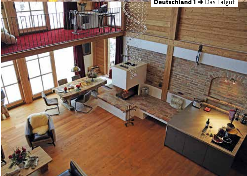
Deutschland 1 → Das Talgut

»Heimelig anmutende Wohnwelten, Liebe zum Detail und legere Exklusivität«: Das verspricht Inhaberin Sabine Horlacher mit ihren neu gestalteten Ferien-Lodges in Ofterschwang im Oberallgäu. Sabine Horlacher hat das privat geführte, historische Gutsanwesen von 1908 – in einer der schönsten Panoramalagen des Allgäus mit Blick auf den Golfplatz Sonnenalp und imposante Berge vom Grünen bis zum Nebelhorn – mit viel Herzblut renoviert. Entstanden sind fünf lichtdurchflutete, komfortable Wohnwelten mit 80 bis 320 Quadratmetern bis hin zur Premium-Lodge mit einer großen Kaminlandschaft. Alle Einheiten können separat gemietet oder miteinander verbunden werden. Bis zu 20 Personen finden im Talgut Platz. Neben dem Frühstücksservice gibt es bei der Anreise Probchen des Speiseangebots zum Reinschmecken. Hat man seine Wahl getroffen, werden die Mahlzeiten täglich frisch zubereitet im Kühlschrank platziert. Wann immer sich der Hunger regt, das Glas kurz im Ofen erhitzen, und fertig ist das leckere Mahl. Der 18-Löcher-Platz Sonnenalp liegt fast vor der Haustür. Aktuelles Angebot: eine Woche in der Esprit-Lodge (für zwei Personen), täglich Frühstückskorb, drei Greenfees und Shuttle zum Platz sowie kostenlose Fahrten mit der Bergbahn für 1.256 Euro p. P. Infos: talgut.de